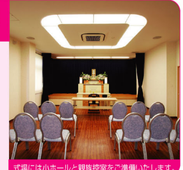
式場には小ホールと親族控室をご準備いたします。