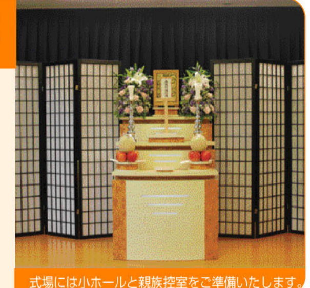
式場には小ホールと親族控室をご準備いたします。